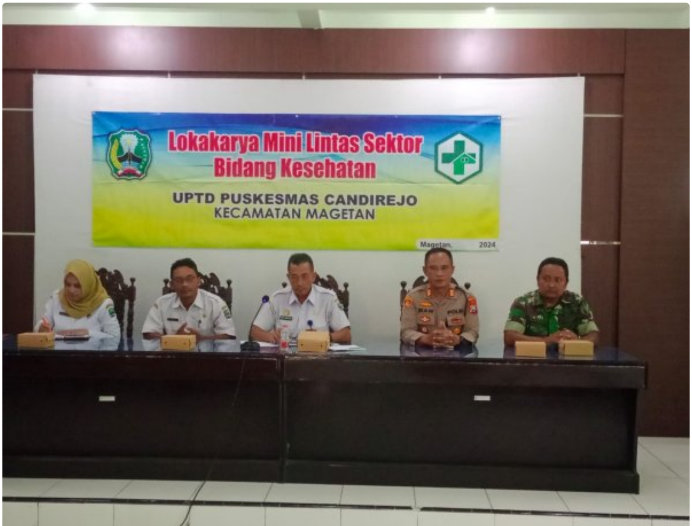
Bati TUUD Koramil 0804/01 Magetan Hadiri Loka Karya Mini Lintas Sektor Tri Bulanan Bidang Kesehatan

MAGETAN. - Bati TUUD Koramil Tipe B 0804/01 Magetan Kodim Magetan Pelda